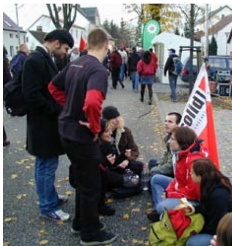
Halbe 2006 - Tag der Demokraten

Schulungs- oder auch Versammlungsobjekt in der Prignitz, in Oberhavel oder in Oder-Spree unterstreicht diese Aktivitäten. Mit ihrer „Wortergreifungsstrategie“ versucht sie Veranstaltungen der Demokraten als Podium für die Verbreitung ihrer Ideologie zu gewinnen.