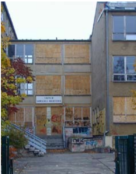
Stadtumbau zwischen Abriss ...

Der demografische und strukturelle Wandel vor Ort zwingt die Städte, im Sinne der Erhaltung lebenswerter Städte neue Wege in der Stadtgestaltung zu beschreiten. Brandenburg wird bis 2015 bis zu 30% seiner Bevölkerung verloren haben. Damit sind zwei Drittel der Bevölkerung von den Stadtumbauprozessen direkt oder indirekt betroffen. Das resultiert u. a. aus