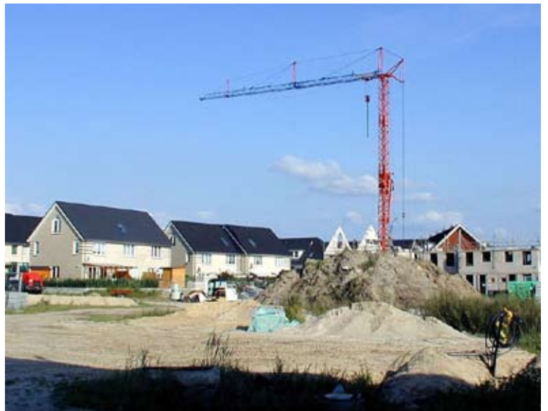
... und Neubau

Einer dieser Akteure ist die Kommunalpolitik. Angesichts der Vielschichtigkeit und Komplexität dieses Prozesses ist es zwingend erforderlich, den Erfahrungsaustausch auf kommunaler Ebene zu aktivieren und voneinander zu lernen. Genau deshalb ist es auch im Rahmen der Leitbilddebatte angezeigt, diesen Erfahrungsaustausch zu organisieren und gemeinsam Schlussfolgerungen abzuleiten. Unumgänglich für eine weitere erfolgreiche Gestaltung des Stadt-